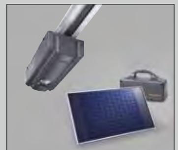
ProMatic 2 -akku Solar-moduulilla

ProMatic 2 -akku autotalleihin, joissa ei ole verkkovirtaliitäntää