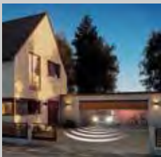
Garagen- und Einfahrtstör-Antriebe Mit den originalen Antriebsgeräten für Hörmann- und andere Porten Mit einer intelligenten Steuerung, Licht, Sensor und anderer Funktionen

Hörmann autotallinoven käyttölaitteet sopivat erinomaisesti Hörmann nosto-oviin. Kohdatessaan esteen vakiovarusteena oleva poiskytkentäautomatiikka pysäyttää oven luotettavasti ja turvallisesti. Ja pehmeä käynnistys ja pehmeä pysäytys avaavat oven tasaisesti ja hiljaisesti. Tyylikkäillä käsilähettimillä portin voi avata autosta käsin, aivan kuten television kauko-ohjaimella. Tai voit ohjata ovea kiinteillä käyttölaitteilla, kuten esim. radiokoodikytkimellä tai -sormilukijalla.